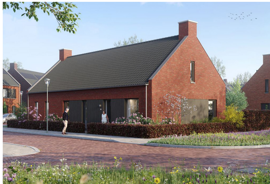
Woningen zuidzijde Verlengde Schoolstraat