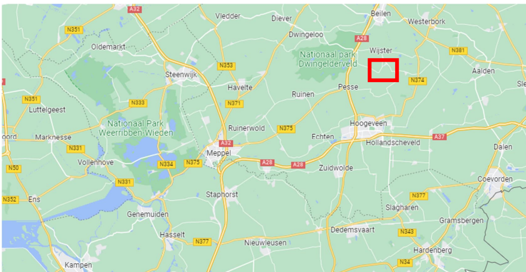
Figuur 1.1 | geografische ligging van het voorgenomen hoogspanningsstation Wijster

De nieuwe hoog- en middenspanningsstations die TenneT, Enexis Netbeheer en Rendo gaan bouwen, worden met ondergrondse hoog- en middenspanningskabels of bovengrondse hoog- en middenspanningsverbindingen verbonden met het bestaande elektriciteitsnetwerk van TenneT. Dit gebeurt met nieuwe of bestaande ondergrondse kabels en bovengrondse verbindingen. Zo worden de nieuwe stations onderdeel van het elektriciteitsnetwerk en zorgen zowel de nieuwe kabels als de nieuwe stations voor versterking van het elektriciteitsnetwerk. In figuur 1.2 is de geografische ligging van het te realiseren hoogspanningsstation Wijster weergegeven.