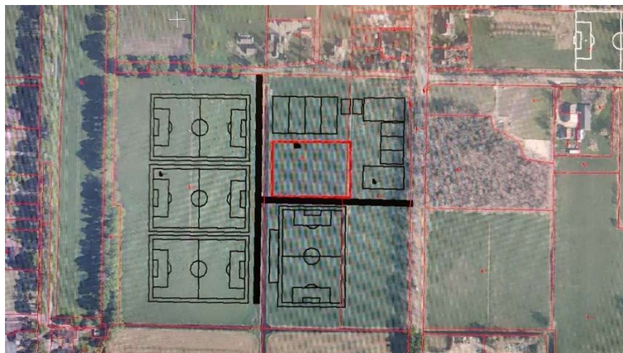
Figuur 9: Clustering Zuideropgaande

Om een totale clustering mogelijk te maken is er gekeken naar een geheel nieuwe locatie. Aan het Zuideropgaande is hier in theorie voldoende ruimte voor. Op deze manier is een ideale clustering van alle gewenste voorzieningen te realiseren.