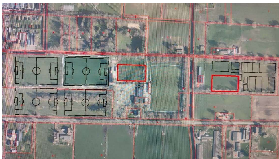
Figuur 10: Clustering de Oosthoek

Een laatste mogelijkheid die is onderzocht is het clusteren van de tennisbanen, korfbalvelden, voetbalvelden en sporthal op het bestaande sportpark aan de Oosthoek.