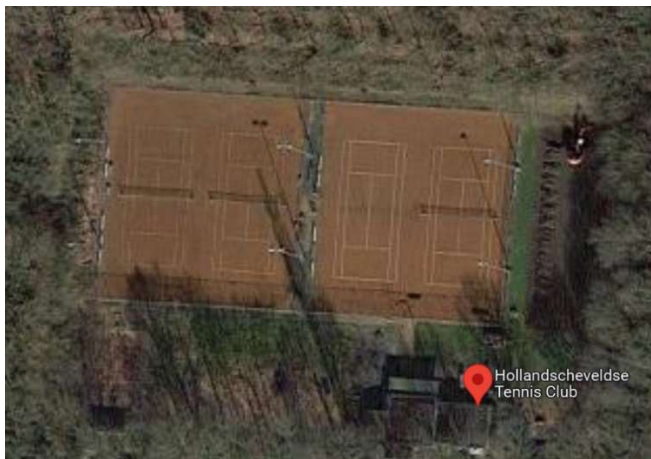
Figuur 4: Tennispark HTC

Achter sporthal de Marke ligt sportpark de Boshoeck. Hier is tennisvereniging HTC gehuisvest. De vereniging pacht de locatie van de gemeente. De vereniging is zelf eigenaar van de kantine en tennisbanen en verzorgt ook zelf het beheer en onderhoud. Op de accommodatie zijn 4 gravel tennisbanen aanwezig en 2 nieuwe (2022) pickleballbanen.