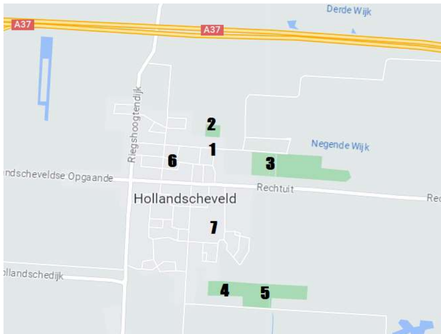
Figuur 1: Overzichtskartaal sportaccommodaties en scholen Hollandscheveld

Hollandscheveld is de tweede kern van de gemeente Hoogeveen. Het dorp telt circa 4.500 inwoners. In Hollandscheveld zijn diverse sportaccommodaties beschikbaar die verspreid over het dorp liggen.