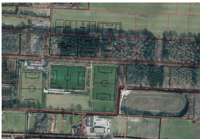
Figuur 8: Clustering sportpark 't Hoge Bos

Op basis van onderstaande schets is beoordeeld of diverse sportfuncties zijn in te passen op het bestaande sportpark 't Hoge Bos. Aan de noordzijde van de Kerkhoflaan zijn de tennisbanen, korfbalvelden, voetbalveld en sporthal ingepast.