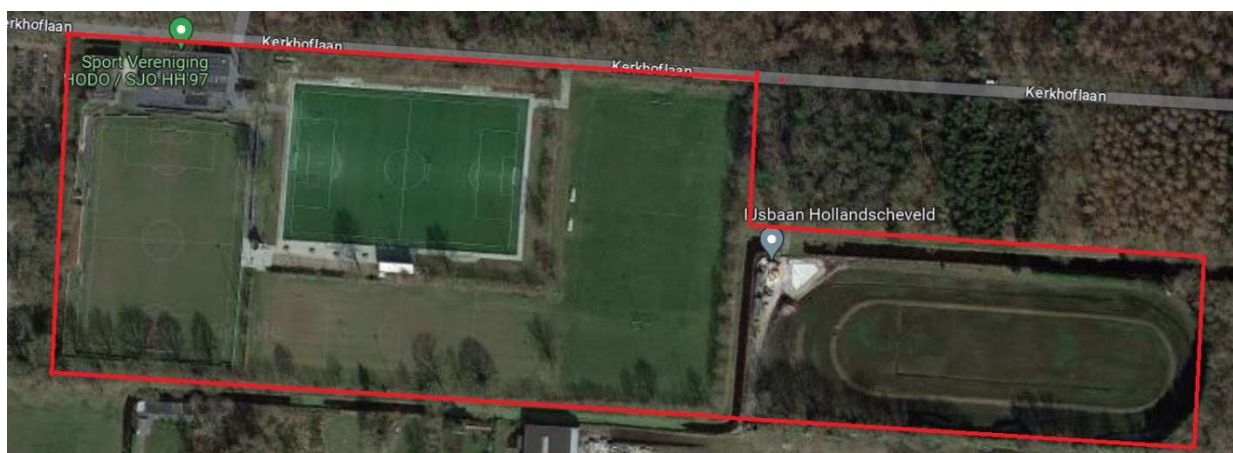
Figuur 5: Sportpark 't Hoge Bos