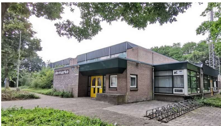
Figuur 3: Sporthal de Marke Hollandscheveld